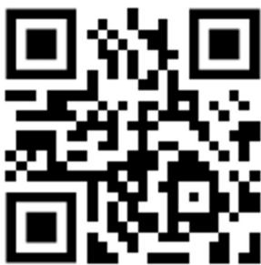
Vidéo de présentation